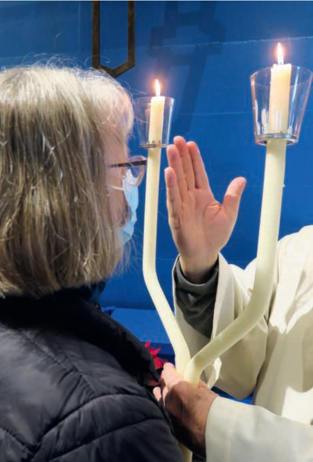
Etwas Gutes sagen mit dem Blasiussegen.

In der ersten Februarwoche finden traditionsgemäss verschiedene Segnungen statt. Segnen heisst auf Lateinisch «benedicere», was übersetzt heisst: etwas Gutes sagen. In den Gottesdiensten der kommenden Tage sagt Gott uns etwas Gutes zu. Und es ist doch wohltuend, wenn ich als Mensch so von Zeit zu Zeit ganz ausdrücklich eine besondere Zuwendung erlebe.