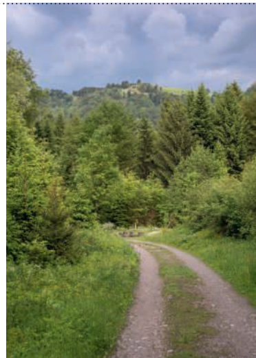
Waldweg im Hasliwald.