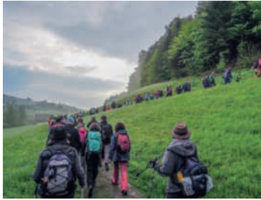
An der Fusswallfahrt 2019.

Essensausgabe an einem katholischen Internat. Die Schülerinnen und Schüler stellen sich brav in einer Reihe an. Eine Schale voller Äpfel steht bereit am Buffet, die Kinder dürfen sich selber bedienen. Eine Nonne klebt einen Notizzettel auf die Schale: «Nimm dir nur einen. Gott schaut zu.» Etwas weiter vorne wartet ein grosser Stapel Schokoladeguetzli. Eine Schülerin nimmt Blatt und Papier und kritzelt dazu auf einen Zettel: «Nimm, so viel du willst. Gott überwacht die Äpfel.»