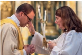
Kerzenritual und Bitte um Gesundheit.

Der heilige Blasius – sein Gedenktag ist am 3. Februar – war im 4. Jahrhundert Bischof von Sebaste (das heutige Sivas in der Türkei). Er hat der Legende nach als Märtyrer im Gefängnis ein Kind von einer Fischgräte im Hals befreit. Ebenfalls half er einer armen Frau, die von da an jährlich eine Kerze opferte. Blasius betete auch, dass alle, die an einer Halskrankheit litten, Erhörung fänden, wenn sie in seinem Namen um Gesundung bäten. Im Blasiussegen verbindet sich das Kerzenritual mit der Bitte um Gesundheit. Den Brauch gibt es etwa seit dem 16. Jh. Blasius wird auch zum Schutz gegen Zahnschmerzen angerufen. aw/sys