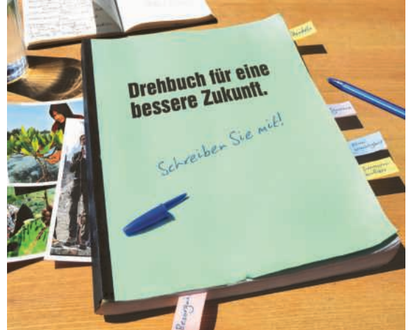
Der aktuelle Fastenkalender: ein Drehbuch.