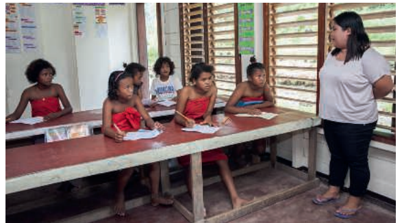
Impressionen von den Philippinen.