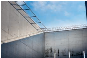
Die Strafanstalt Grosshof in Kriens.

arbeitet eng mit der Gefängnis-sorge zusammen, die ebenfalls von den Kirchen finanziert wird.