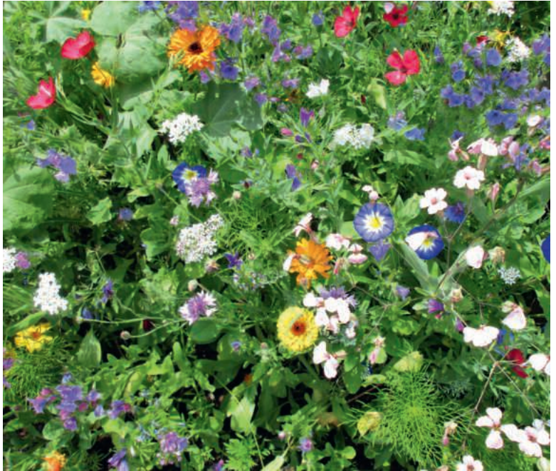
Eine grosse Vielfalt an Kräutern und Blumen, die uns mit ihren verschiedenen positiven Eigenschaften guttun.

Je nach Tradition werden sieben, neun oder zwölf Kräuter in die Kräuterbüschel gebunden. Laut Anselm Grün steht in der Mitte die Königskerze, als Zeichen für unsere königliche Würde und Schönheit. Rundum reihen sich die Schafgarbe und der Frauenmantel als Frauenmittel, der Haselnusszweig für Schutz, der Beifuss für