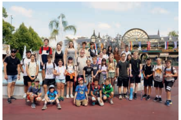
Im Europapark Rust.