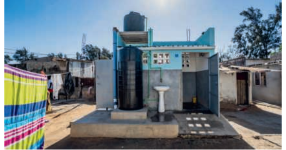
Sanitärblock in Maputo, Mosambik.