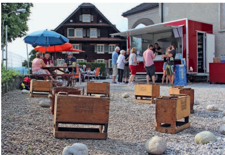
AltBar Bueri bei der alten Kirche Buchrain.