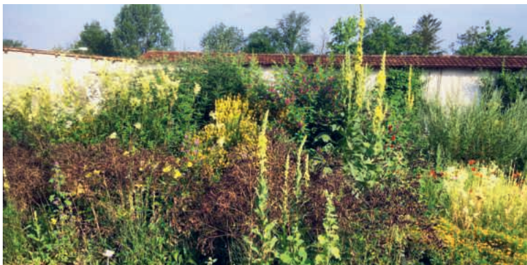
Gewürz- und Kräutergarten bei der Klosterkirche in Rathausen.

Montag, 15. August, um 9.30 Uhr und 17.00 Uhr