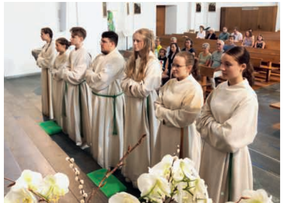
Vier austretende Ministrantenleiter*innen und drei neue Oberministrantinnen.