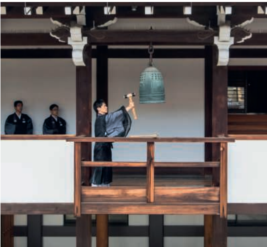
Tempel-Zeremonie in Kyoto, Japan.

Samstag, 27. August um 17 Uhr Abschied nehmen