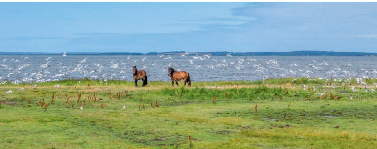
Pferde und Möwen in Jütland, Dänemark

D och frag nur die Tiere, sie lehren es dich, die Vögel des Himmels, sie künden es dir. [...] Wer von ihnen allen wüsste nicht, dass die Hand des Herrn dies gemacht hat?