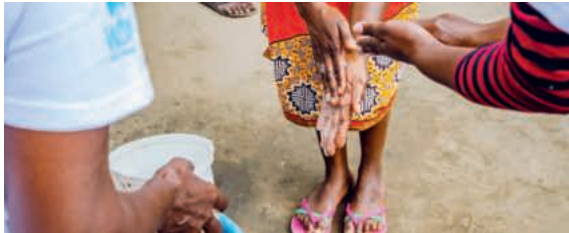
WASH-Schulung in Maputo.

In Sambia und Mosambik setzt sich WfW für einen sicheren Zugang zu Wasserversorgung, sanitären Anlagen und für wasserspezifische Berufsbildung ein. Dabei ist die Organisation in strukturell benachteiligten urbanen Räumen tätig und arbeitet eng mit lokalen Organisationen und Institutionen zusammen.